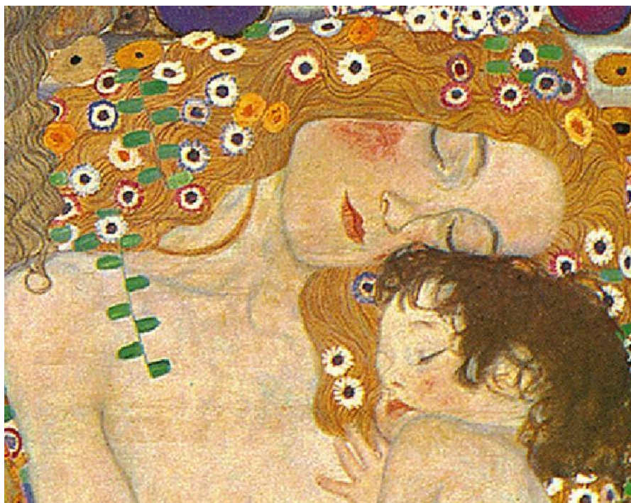
Gustav Klimt "Madre e Figlio"